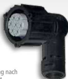
Bajonett-Kupplung nach ISO 15170-1 (auf Anfrage)