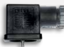
Rechteck-Steckverbinder nach DIN EN 175301 (auf Anfrage)