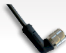
M12x1 Steckverbinder nach DIN EN 61076 (auf Anfrage)