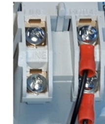
Counter wires connected to MOTOR/MOTOR terminal